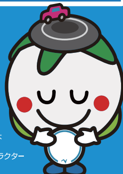
NEXCO西日本 中国支社 マスコットキャラクター ウェイウェイ

浜田自動車道・山陰道(江津道路)に並走する県道52号・5号・国道186号・9号・県道330号への迂回をお願いします。